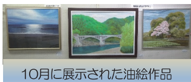
10月に展示された油絵作品