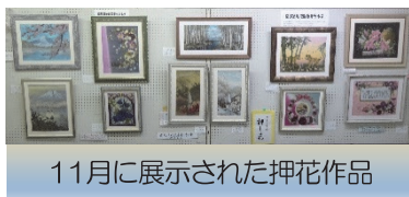
11月に展示された押花作品